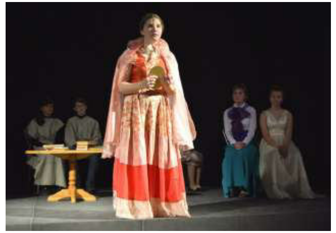
Лопе Де Вега «Дурочка» (работа Николаевой Анастасии)