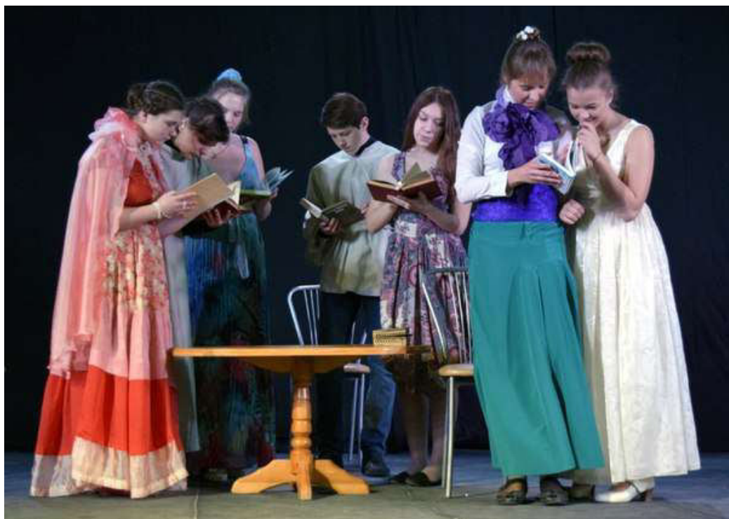
«Немного о любви» (по произведениям русских и зарубежных авторов)